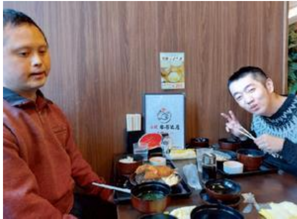
【外食にもいけるようになりました】