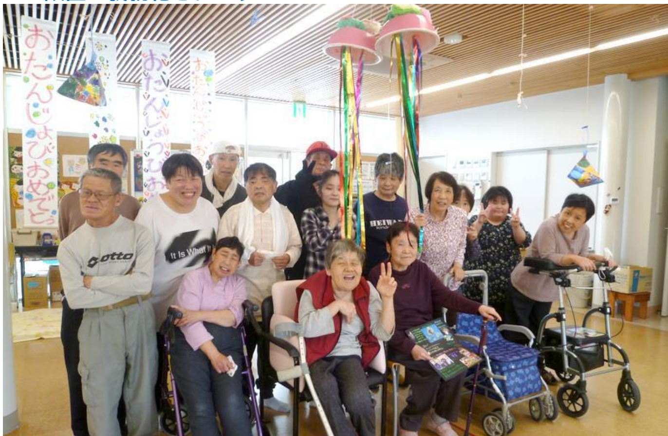
【パワーズ山田の皆さん】

◆令和6年4月からBCP（事業継続計画）の策定と感染対策委員会の設置が義務化されます