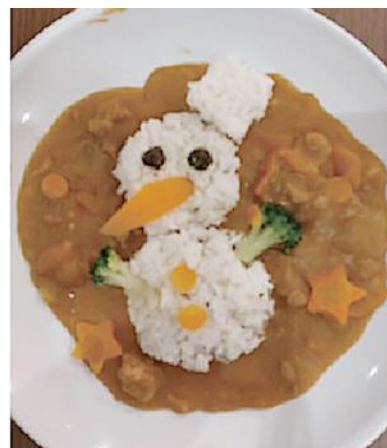
【みんなで作ったデコカレー】

コロナウイルスが流行してからは、例外なく他のグループホームと同じように以前とは違う規制がありました。楽しいはずの食事でも黙食だったり、週末のお出かけも我慢したりの日々が続きました。入居されている利用者さんは積極的に手指の消毒なども行ってきて感染する方が出ずに済んでいるところです。我慢を強いられている利用者さんに少しでも楽しんでもらえたらと週一回のカレーライスの日でデコカレーにしたり、テイクアウトをして食事をとってもらったりしました。この状況も徐々に緩和され、買い物や外食へ行ったり、昨年のクリスマス会ではバイキング形式でパーティーを行い笑顔があふれる時間を過ごせました。