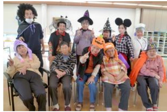
【ハロウィンでは仮装をしました】

最近では、介護施設へ移行される方や、併用して利用される方が増えてきました。介護保険優先のため65歳でサービスが利用できないと言われるケースも増えています。市町村に対して、「本人の意向を大事にして欲しい」と訴え続けていかなければならないと考えています。もちろん、現在の環境で適応できなくなる場合は、次の活動先をコーディネートしていかなければなりません。