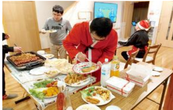
【クリスマス会をしました】