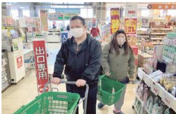
【お買い物でリフレッシュ】