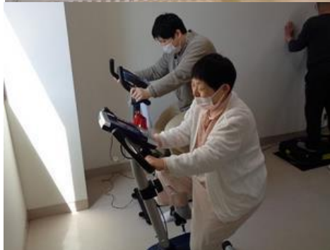
【機器を利用したの運動】

【松崎】 いろいろ工夫されて活動されているようですが、今抱えている課題と言ったら何でしょうか。