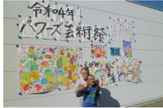
【芸術発表会をしました】