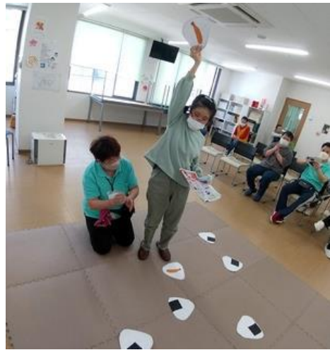
【おにぎり神経衰弱】

活動内容は、生活の活動は3つの班に分かれ、委員会活動（利用者の方が役割を持って、ご自分たちの生活を創っていく活動）、創作活動、生活支援などを行っています。運動はエアロバイクやバランスウェーブなど機器を使ってトレーニング行ったり、ゆったりとストレッチを行ったりしています。仕事は玉ねぎ・にんじん・じゃがいもの皮むき作業を行っています。剥いた野菜はカット野菜となって病院や学校の給食などに使われます。余暇は、レクリエーション、サークル活動、休日営業など楽しみやゆとりを持てる活動を行っています。