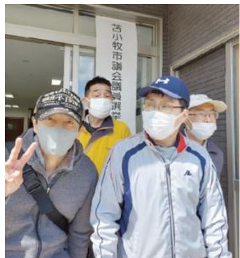
【投票後の安心した表情】

今年は統一地方選挙があり、北海道知事選や、市議選へ行くときには事前に新聞などで顔や名前などをチェックしてから投票場へ出向きました。何度か投票は経験しているのですがあの投票場の独特の雰囲気緊張気味の表情で入って行き、出てきたときには安心感と達成感の笑顔でした。