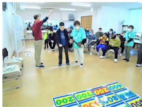
【オリジナルのポッチャ】