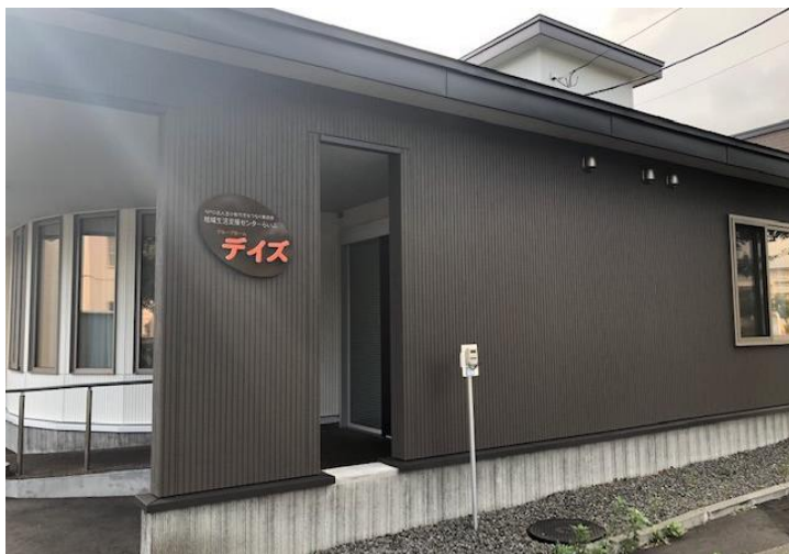
【グループホームデイズ】