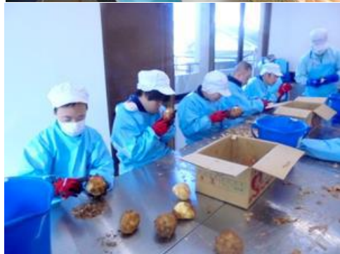
【野菜の皮むき作業の様子】