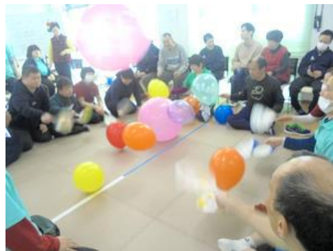
【風船パタパタゲーム】

「夢工房みどり」は、療育・健康・進路の3つの視点をテーマに取り組んでおり、療育では、生活・運動・仕事・余暇の4つの活動を通して、分かり易さ、安心感、自己肯定感を感じていけるような支援を目指しています。また、身体的・精神的・社会的の3側