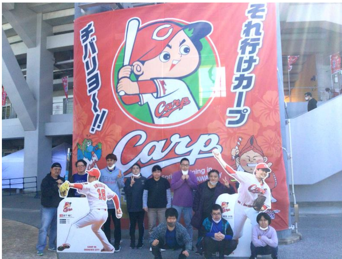
【応援幕の前で集合写真を撮りました】

名簿を検索して準備万端で行きました。球場ではプリントアウトしてきた選手名簿を頼りに、背番号と名前を照らし合わせ、有名選手を探す利用者たちの瞳は、あたかも大好きなアイドルとの遭遇のように喜びに溢れ、満面の笑みは明日への活力の素となるに違いありません。