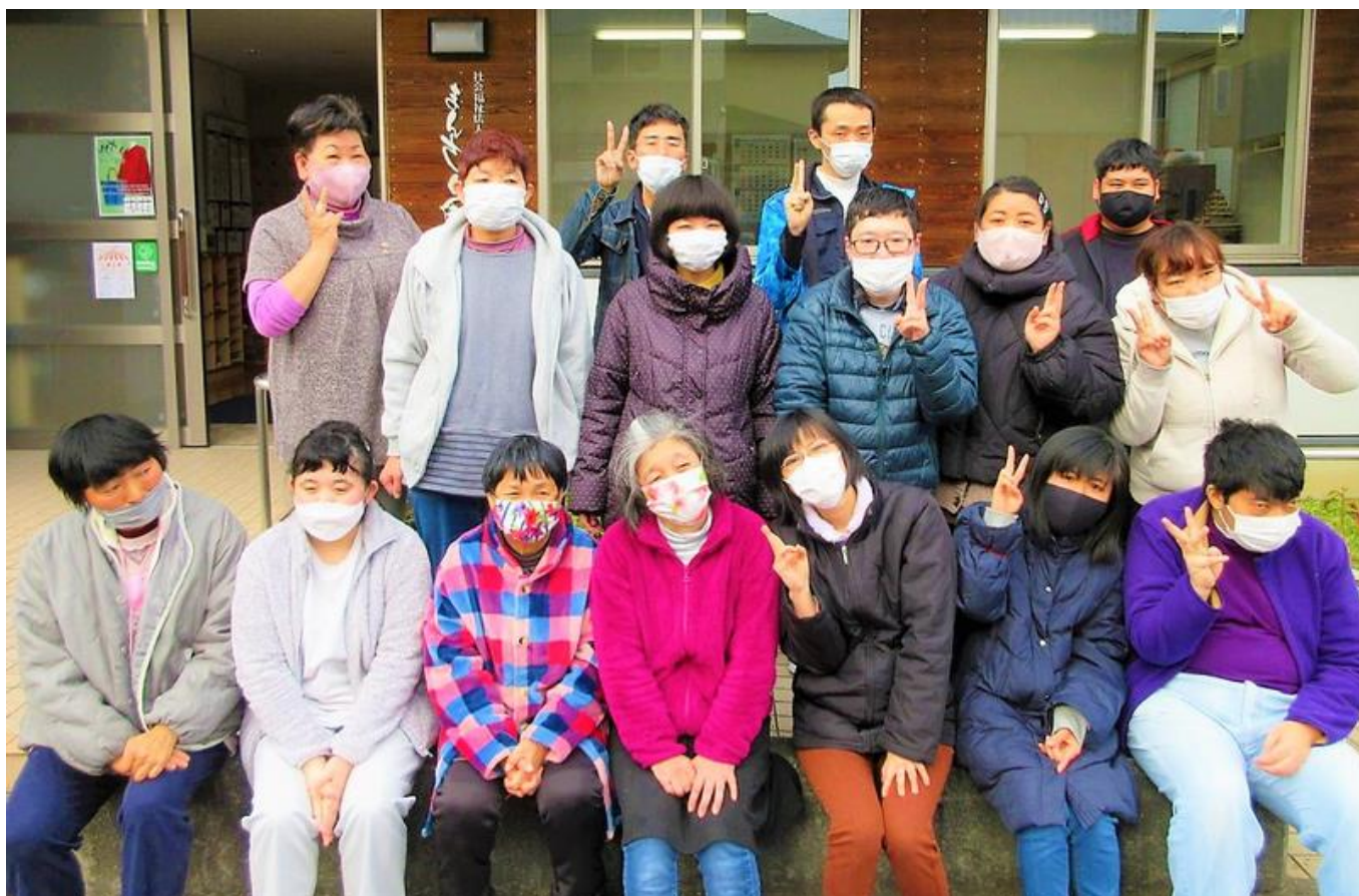
【まんさく園の皆さん】