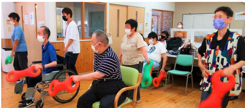
【体を動かすレクリエーション活動も取り入れています】

授産活動は、大きく2つあります。ひとつは、設立当初から取り組んでいる“さをり織”です。小型のハタを使い、利用者の自由な手織りによってできた一点物の織布を、バッグや服などに仕立てて販売しています。温かみのある素朴な風合いが人気です。もうひとつは、店舗運営を伴う飲食事業。カレーなどの料理や、クッキーなどの焼菓子を作り、園舎に併設するカフェ「クミン」で提供しています。レトルトカレーを委託販売に出したり、キッチンカーでイベント出店することもあります。