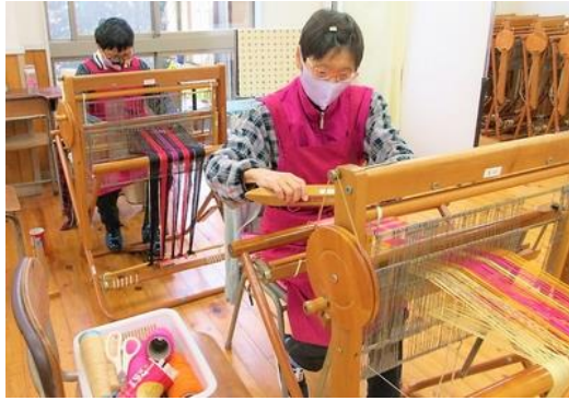
【さをり織の作業の様子】