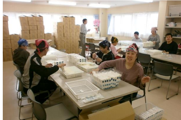
【「ひいらぎ」での作業の様子】

「ひいらぎ」は就労支援B型の事業所ですが、働くということの意味をよく考えさせられます。定年の問題もありますが、本当に皆働きたいのかと。もちろん働きたい人もいらっしゃいますが、周りの流れがそうだからそうしている、それしか知らないからそうしている人も多いと思います。