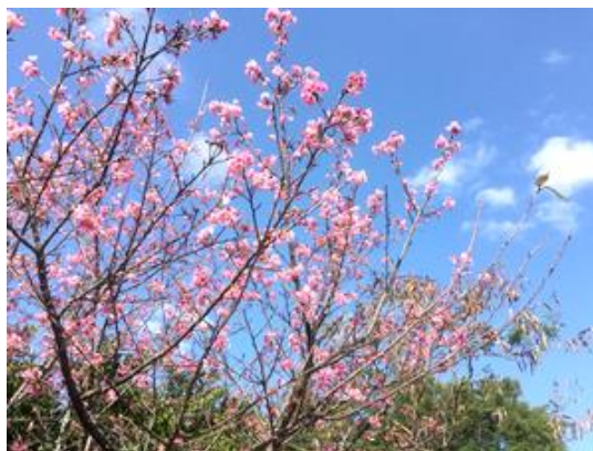
【沖縄の桜「琉球寒緋桜」】

私たちの住む沖縄は、秋、冬、春が瞬時に通り過ぎ、辛い冬より暖かい夏を長く過ごすために、「耐え偲ぶ」ことより「なんくるないさ(何とかなるよ)」との意識が生まれたのかもしれませんがね。(笑)