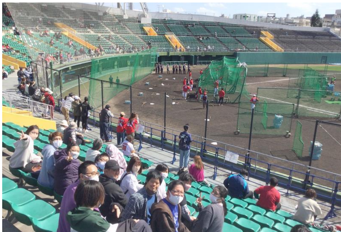
【この日の最高気温は22度でした】

ここまで広島カープを一押しでこの原稿を書いています。実は根っからの巨人ファンであることは利用者の皆さんに内緒です。