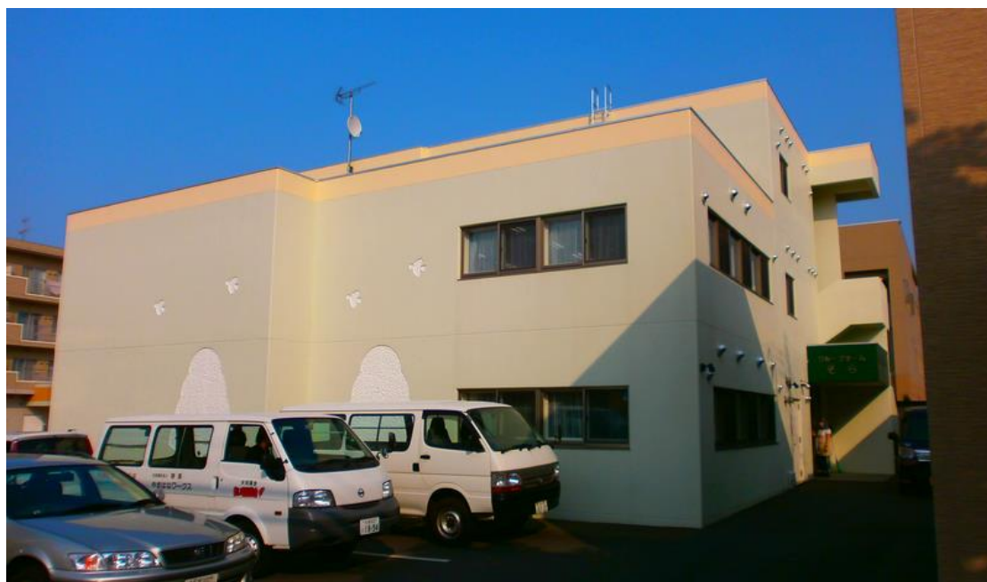
【朔風支援センターささえーるの外観】

そこで、身体障害のお子さん（軽度の知的もあり）と出会い、初めて福祉というものを意識する機会が出来ました。直ぐに書店に行き初めて福祉の本を読み、なんとなくではありますが札幌市内の福祉施設を見学してみようと思い、複数見学しました。その見学した時に、こういうところで働いてみたいと感じ、この仕事に就くことになりました。当時は、資格もなく学歴もないため面接すら行ってもらえないことが多く、就職するのに苦労した記憶があります。