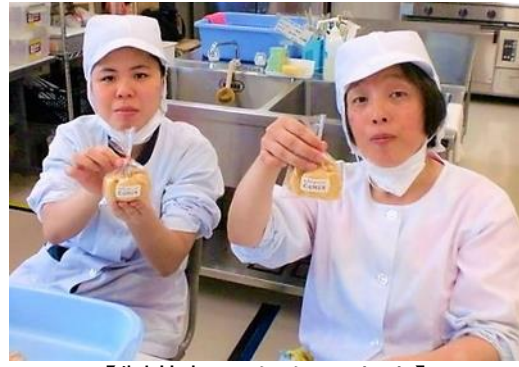
【製菓部門もあります】