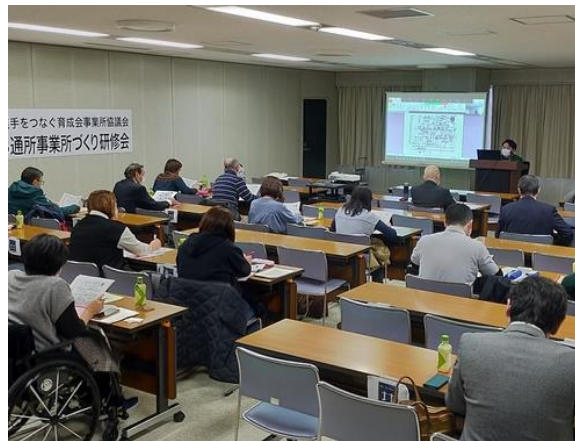
【当日の現地会場の様子】

北海道ブロックでは年間2回の研修会を実施しており、今回はその2回目となる研修会で「魅力ある事業所づくり研修会」と題し、「運営力を高める」「支援力を高める」の2部構成で講師をお招きして開催しました。北海道はこの時期、新型コロナウイルス感染の第8波の真只中ということもあり、現地参集とオンライン参加のハイブリッド形式で全道から約100名の会員事業所職員が参加しました。