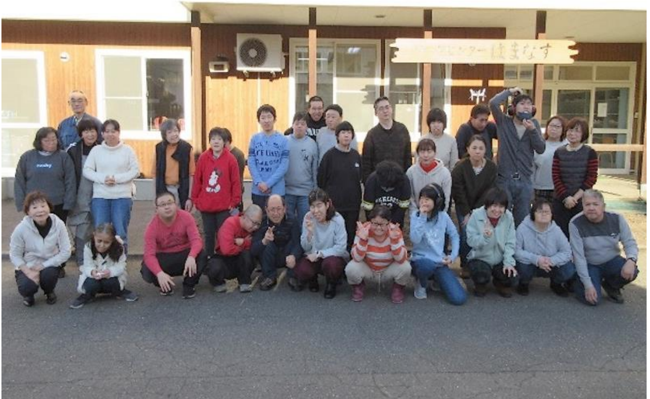
【ワークセンターはまなすの皆さん】

◆「魅力ある事業所づくり研修会～運営力を高める・支援力を高める～」 (12月3日)を開催しました(北海道ブロック)