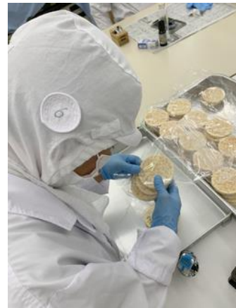
【食品加工作業の様子】

工賃については、くるみ共同作業所のB型で月額一人平均3万6千円、生活介護でも1万6千円です。事業所としては年間5千万円～6千万円弱を目指して取り組んでいます。