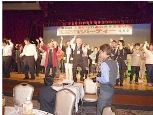
【地域交流パーティーの様子】

障がいがある方たちが地域で過ごす、その地域とつながりを持っていてもらいたいですね。うちの作業所には作業療法士を持っている職員が6人いますが、障害のある方たちのこと、情報を発信して、いろいろなところで知ってもらう、発信する仕事としてとらえ、住みやすい暮らしを応援することをしていてもらいたいです。