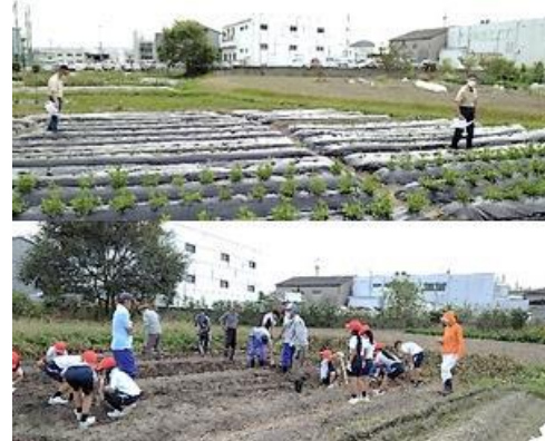
【畑での農作業や地域交流】

隣の畑では、自治会長さんと地域の人達が季節の野菜を数多く作っています。土作りの手伝いや栽培方法のアドバイスをいつもしてくれます。その度に「暑い中、水やりや草抜き、よくやっているね。沢山できたね。また、小学校の芋掘り、一緒に掘ってね。」と声掛けをしてくれます。そのようなやりとりに、みんなニコニコ、お礼の言葉とOKのサインで返答しています。