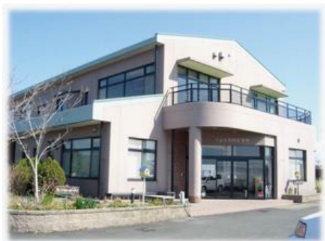
【くるみ共同作業所の外観】

【峰野】 くるみ共同作業所では就労継続B型では施設外就労をメインにしている、生活介護も仕事を通しての活動が中心となっています。生産活動を中心に展開している生活介護だからか重度の方（医療的ケアが必要な方