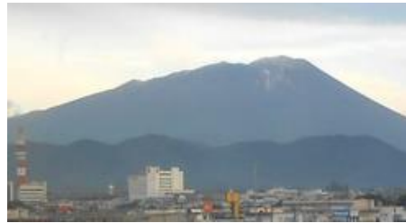
【初冠雪した岩手山（10/6）】

全国的には秋となり、紅葉の真最中ではありますが、岩手では少しずつ冬の気配を感じています