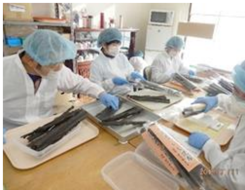
【昆布の袋詰め作業】

なお、お客様のご要望に応じて各種商品の発送も行っておりますので、ご希望がございましたら事業所までお問い合わせをお願いいたします。