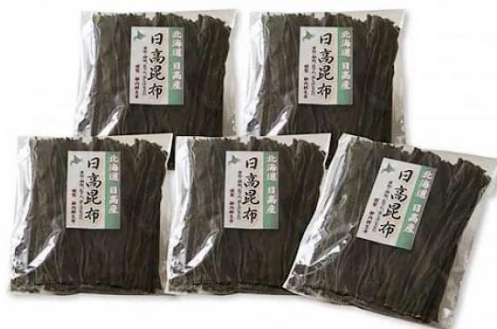
【返戻品に採用されている昆布製品】