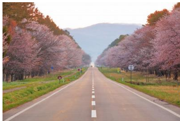
【二十間道路桜並木】

日高山脈を背に太平洋を望む緑あふれる自然に恵まれ、春には「さくらの名所100選」に選ばれた「二十間道路桜並木」があり、直線7Kmに渡ってエゾヤマザクラが咲き誇ることから、全国各地より多くの観桜客が訪れます。