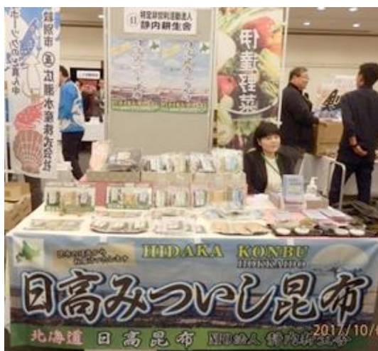
【商談会や出張販売にも出ています】