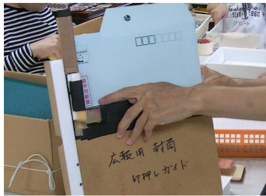
【市広報用封筒に印を押す治具】

このように視覚に障害のある人が様々な作業に取り組んでいますが、法人で力を入れて広めようとしているのが、名刺への点字印刷になります。