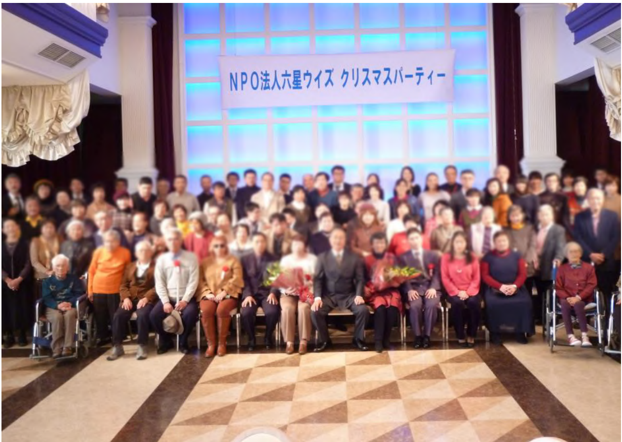
【ウイズ半田の皆さん】