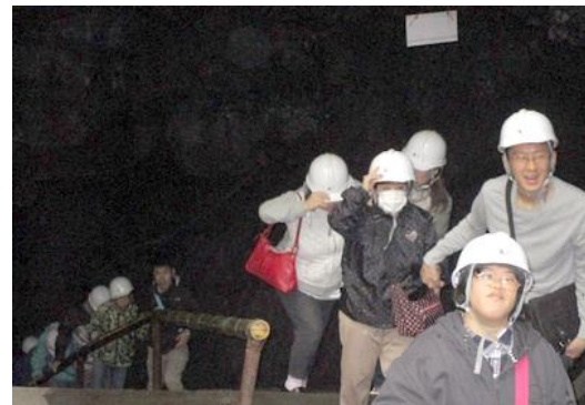
【宿泊行事で富士山の風穴へ】