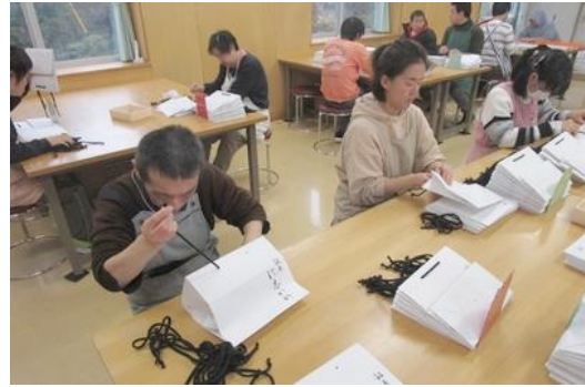
【ショッピングバックの作業】

現在の事業所の実施方針が、現行の法律や制度が目指す方向と合っているのかは分かりません。ただ、昔からの「和気あいあい」とした所を好む方が集まって今の事業所が出来ています。また、これを望む方はこれからもいるでしょう。「利用者が何をしたいのか」「利用者とは何をしたいのか」を忘れることなく、職員一同励んでいきたいと思っています。