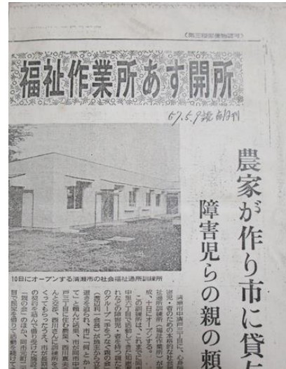
【開所当時の新聞記事】

こうして昭和57年(1982年)、市当局のご尽力と今の大家さんの善意によって完成した建物で、清瀬福祉作業所は現在も活動をしています。