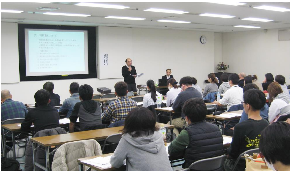
【当日の研修会の様子】

私自身その頃は、「障がいのある人＝助けてもらう側」という認識でしたが、決してそうではなく、自身を持ってやりたいことにチャレンジすることが大事だと、勇気をもらいました。