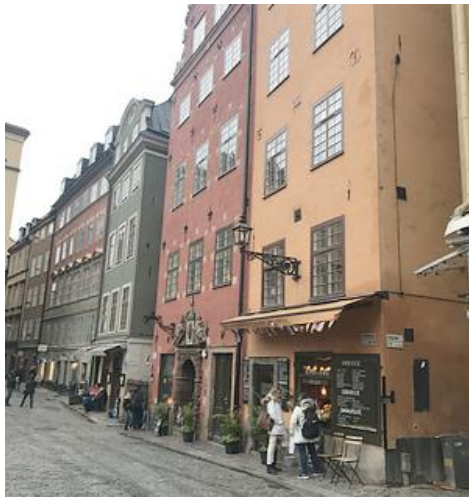
ガムラ・スタン街並み (スウェーデン・ストックホルム)