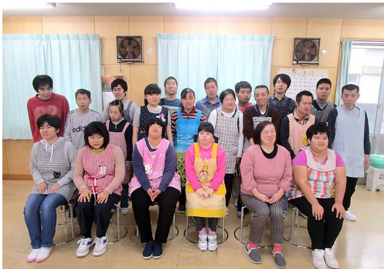
【清瀬福祉作業所の皆さん】