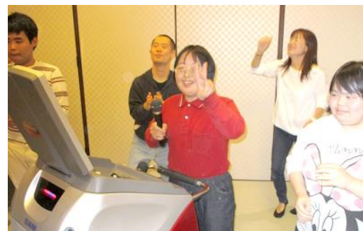
【みんなでカラオケ大会】

また、事業所の1日の中で、何か1つ本人の得意なこと、やりたいことを作り、その人の自信につなげていきたいと思い、食事の配膳や食器洗い、掃除(雑巾がけ)やゴミ捨てなど日々の生活に密着したことも全員で行っています。これは、「こんなことをやる姿を想像できなかつた」とご家庭からは好評です。