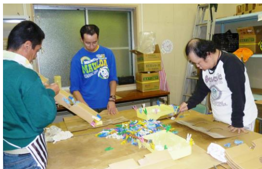
【段ボールの加工作業】

職員の約半数は障がいのある方のご家族で、利用者の想い、ご家族の想いの両方を汲み取りながらサポートをしています。また、親の会の「四日市市手をつなぐ育成会」の役員でもあるので、ご家族と職員の橋渡しも担っていただいています。