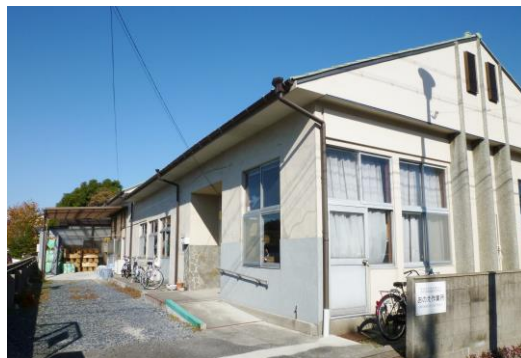
【おのえ作業所の全景】

おのえ作業所は、1983年（昭和58年）10月、子どもたちの養護学校の卒業後の進路の確保という切実な思いから、当時の「手をつなぐ親の会」の保護者たちが四日市市の支援を受けて運営組織を立上げ、1984年（昭和59年）4月に無認可作業所「尾上授産所」としてスタートし、ご家族の想いが託された大事な事業所です。