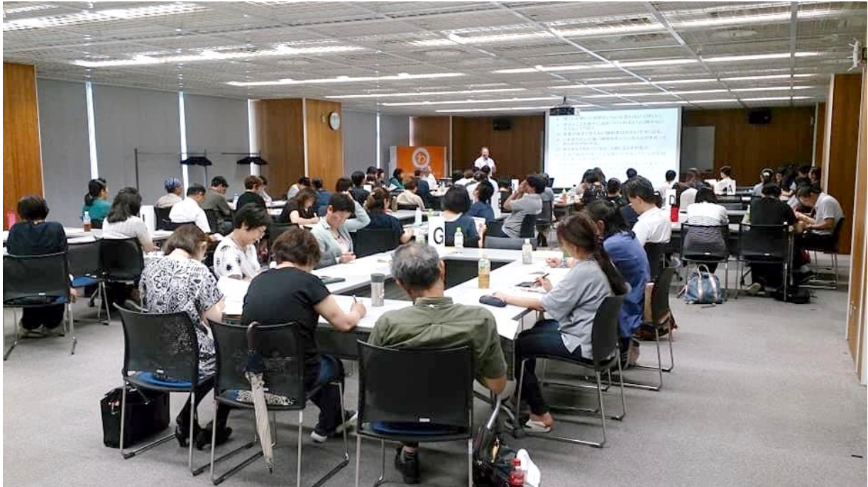
【多数の参加がありました】