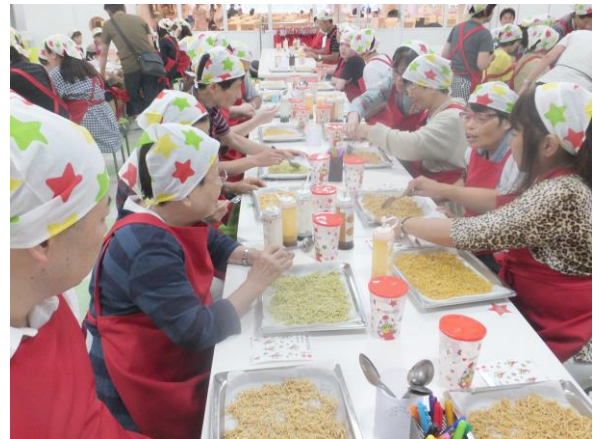
【バス旅行でのひとコマ】

各地の事業所も同様だと思いますが、おのえ作業所でも障がい者本人もご家族も高齢になりつつあります。