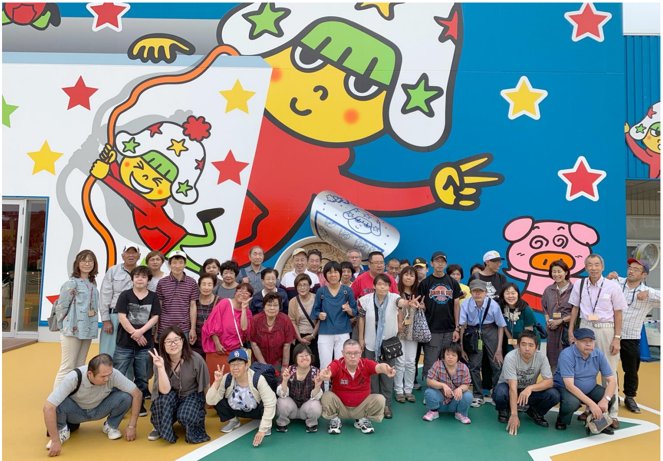
【おのえ作業所の皆さん】