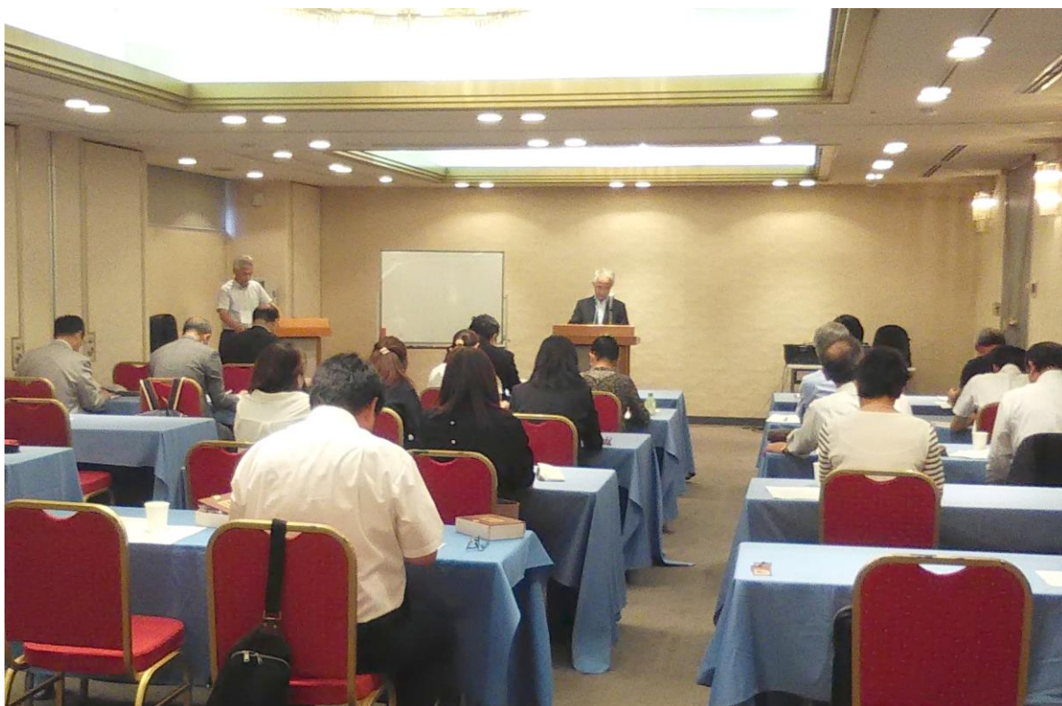
【活発な意見交換もあった会場の様子】