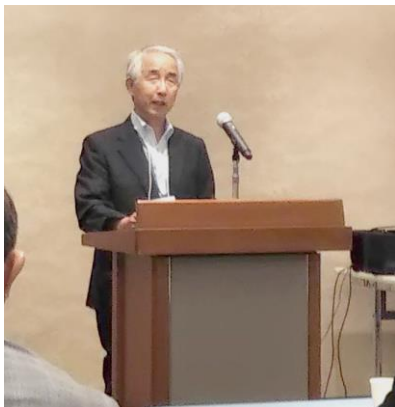
【五十嵐理事長のご挨拶】

今回のセミナーを新潟県で開催した経緯としては、令和3年（2021年）度で開催する全国事業所協議会全国研修大会の候補地として新潟県を考えています。全国研修大会に向けた協議も兼ねての状況からでした。