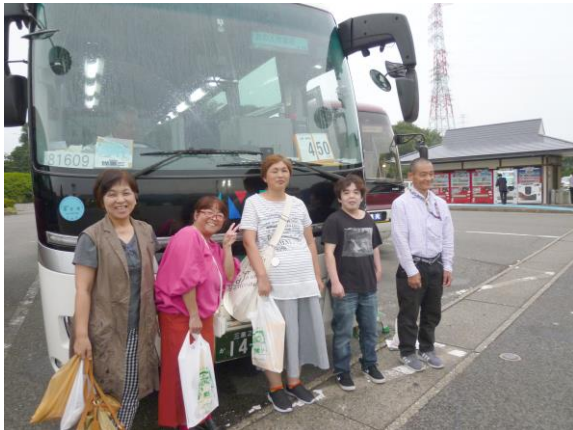
【バス旅行・富田ハウス（GH）の皆さん】

事業所がお休みの週末等には、育成会が主催している本人の余暇支援活動グループ（おとこのこくらぶ・おんなのこくらぶ・ひながの会・さくら会）が月1回あったり、年3回のバス旅行も企画していただいております。休日の楽しみも日々の生活のハリになっています。