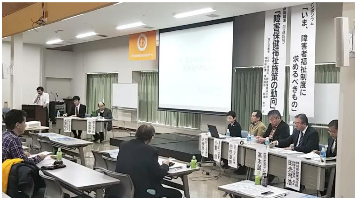
【シンポジウムの様子】

今回のシンポジウムの主旨は、制度とサービス実態が社会福祉として果たしてきた役割・今後のあるべき姿を論じようというものです。特に平成30年度報酬改定が事業所経営に与えた影響は非常に大きく、またその論点自体にも疑問が多々ありましたので、制度の運用主体である行政・サービス提供者である事業者団体・受益者である全国手をつなぐ育成会連合会、きょうされん、特定非営利活動法人 共同連、静岡県作業所連合会・わ、静岡県健康福祉部 障害者支援局よりシンポジストをお招きし、意見交換を行いました。