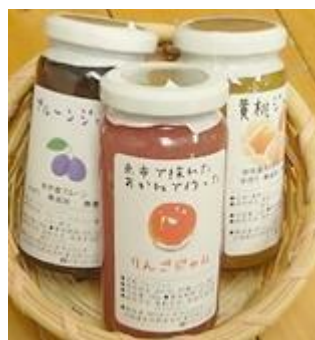
【事業所で製造しているジャム】

また、食品の製造販売の他に下請け作業として、漁業関係で使用する箱を折る作業を毎日しています。所員さんが折った箱にはタラコ、ニシン、カレイなどを入れて全国各地に発送しているそうです。