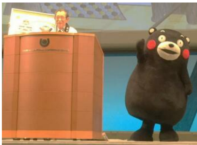
【全国大会・京都大会にて】