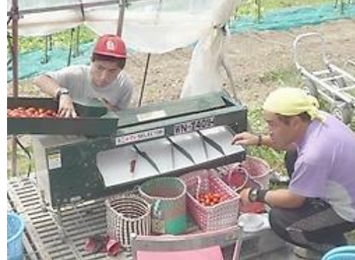
【トマトの選別作業】