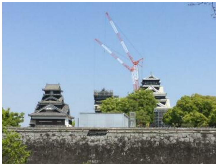
【現在の熊本城（2019年4月）】

そのような状況下ではありますが、「第6回全国手をつなぐ育成会連合会全国大会熊本大会」が、本年11月23日（土）、24日（日）の両日に亘って、オープン直前の熊本城ホールにて開催されます。