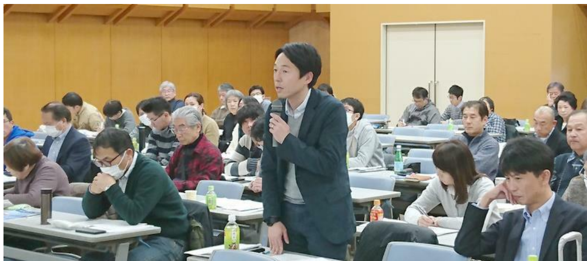
【フロアからも活発な意見発表がありました】

今回のシンポジウムの主旨は、制度とサービス実態が社会福祉として果たしてきた役割・今後のあるべき姿を論じようというものです。特に平成30年度報酬改定が事業所経営に与えた影響は非常に大きく、またその論点自体にも疑問が多々ありましたので、制度の運用主体である行政・サービス提供者である事業者団体・受益者である全国手をつなぐ育成会連合会、きょうされん、特定非営利活動法人 共同連、静岡県作業所連合会・わ、静岡県健康福祉部 障害者支援局よりシンポジストをお招きし、意見交換を行いました。