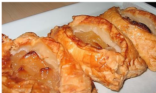
【焼き立てのアップルパイ】