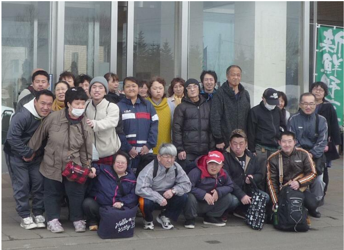
【余市はまなすの皆さんと】