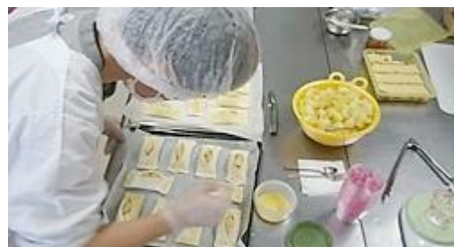
【アップルパイ作り】